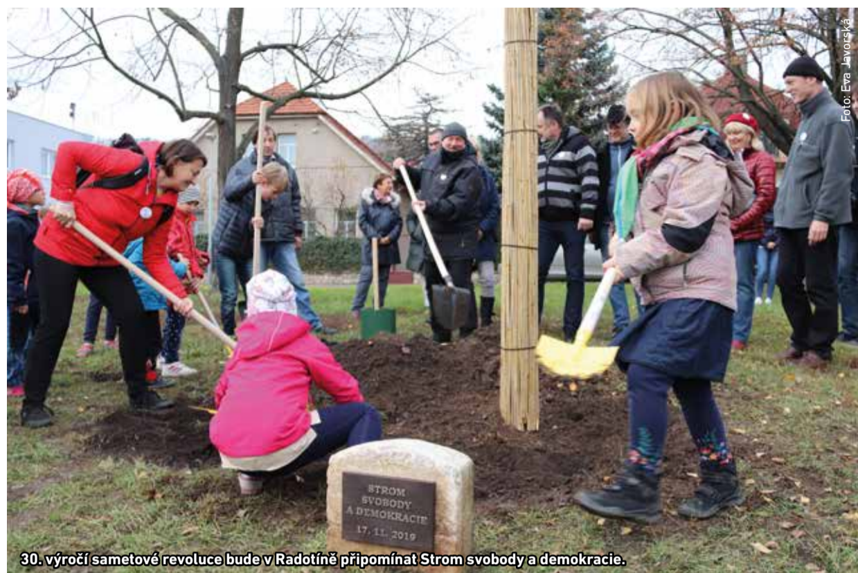
30. výročí sametové revoluce bude v Radotíně připomínat Strom svobody a demokracie.

V parčíku před budovami druhého stupně základní školy roste strom zasazený na počest svobody a demokracie. 17. listopadu v pravé poledne jej tam společně zasadilo vedení radotínské radnice s dalšími asi 70 účastníky slavnostní akce, která se konala k připomenutí kulatého výročí sametové revoluce.