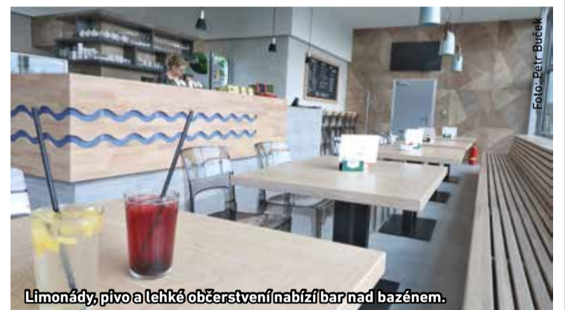
Limonády, pivo a lehké občerstvení nabízí bar nad bazénem.

Nad krytým bazénem už funguje bar, kde se mohou občerstvit plavci i ostatní příchozí. Jeho otvírací doba kopíruje provozní hodiny bazény, v pracovní dny zavírá ve 22 hodin a o víkendů o hodinu dříve. Kromě toho plavecký areál nově nabízí masáže a naplno už se rozjela také venkovní přírodní sauna Kijukiju. ■