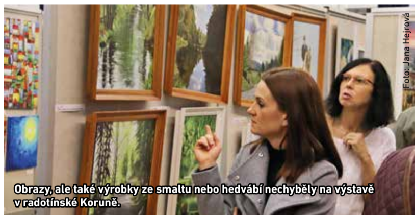
Obrazy, ale také výrobky ze smaltu nebo hedvábí nechyběly na výstavě v radotínské Koruně.