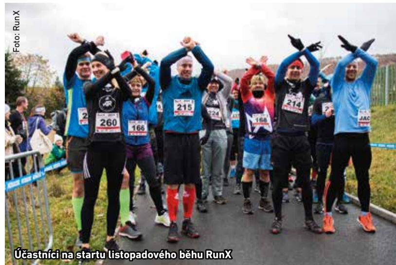
Účastníci na startu listopadového běhu RunX

D ruhého ročníku podzimního závodu ze série RunX, který se běžel oproti loňsku po rov-