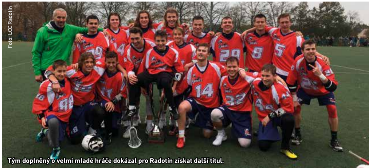
Tým doplněný o velmi mladé hráče dokázal pro Radotín získat další titul.

R adotínští lakrosisté si na závěr sezony připsali další úspěch, když vyhráli finálový turnaj české fieldlakrosové ligy. Souboj o titul přitom přinesl velké drama.