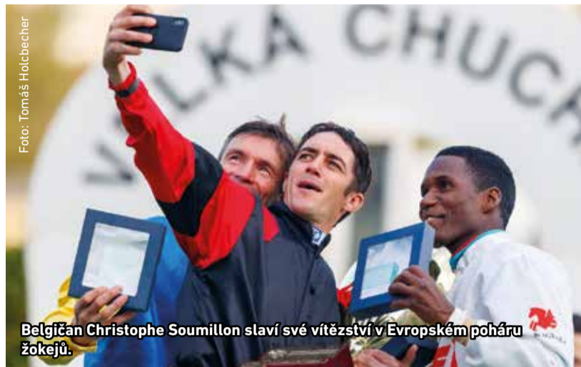
Belgičan Christophe Soumillon slaví své vítězství v Evropském poháru žokejů.

Chuchle Arena Praha – tento název dostalo závodiště ve Velké Chuchli letos na podzim a zároveň zahájilo provoz jezdecké akademie. Zaježdít na koni si během celého roku mohou přijít začátečníci i zkušenější jezdcí.