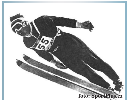
Jiří Raška - olympijský vítěz z roku 1968. Napodobí Jakub Janda jeho úspěchy?

koslovenský sportovec medaili nezískal. Osmá zimní olympiáda byla uspořádána podruhé mimo Evropu. Organizace byla přidělena do USA, konkrétně do Squaw Valley. Zde splnil roli favorita krasobruslař Karol Divín získal stříbrnou medaili. Jediný vzácný kov přivezli naši reprezentanti i z následující olympiády, z rakouského Innsbrucku. Mužstvo hokejistů vybojovalo bronz. Při těchto hrách se počet startujících sportovců dostal přes jeden tisíc (přesně 1091 a 36 států – pozn. red.). Jedna z nejúspěšnějších olympiád pro československý sport byla 10. v pořadí, ve francouzském Grenoblu.