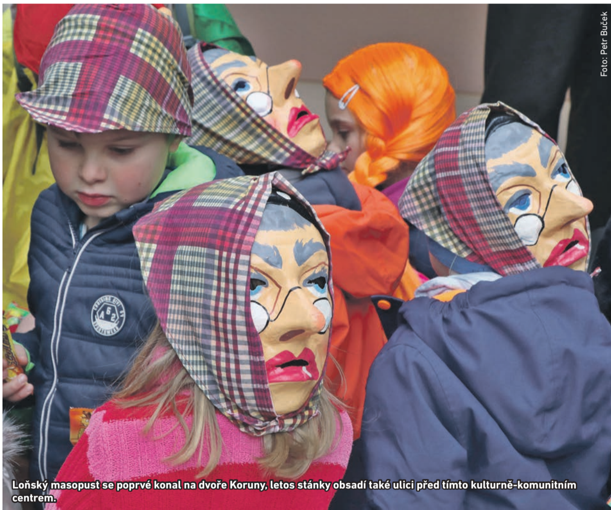
Loňský masopust se poprvé konal na dvoře Koruny, letos stánky obsadí také ulici před tímto kulturně-komunitním centrem.

Pestrý celoroční program společenských a kulturních akcí začal v lednu Radotínským bálem a v únoru pokračuje masopustním veselím. Radotín nabízí široké kulturní vyžití po celý rok i díky štědrosti sponzorů (program akcí na letošní rok naleznete na str. 3).