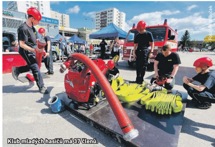
Klub mladých hasičů má 37 členů.