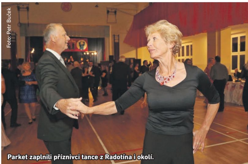
Parket zaplnili příznivci tance z Radotína i okolí.