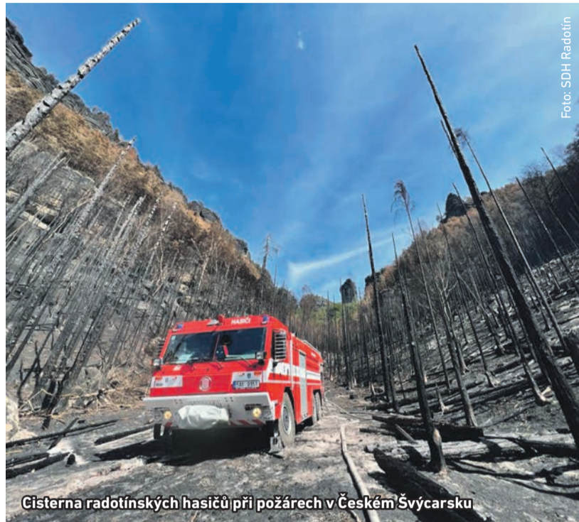
Cisterna radotínských hasičů při požárech v Českém Švýcarsku