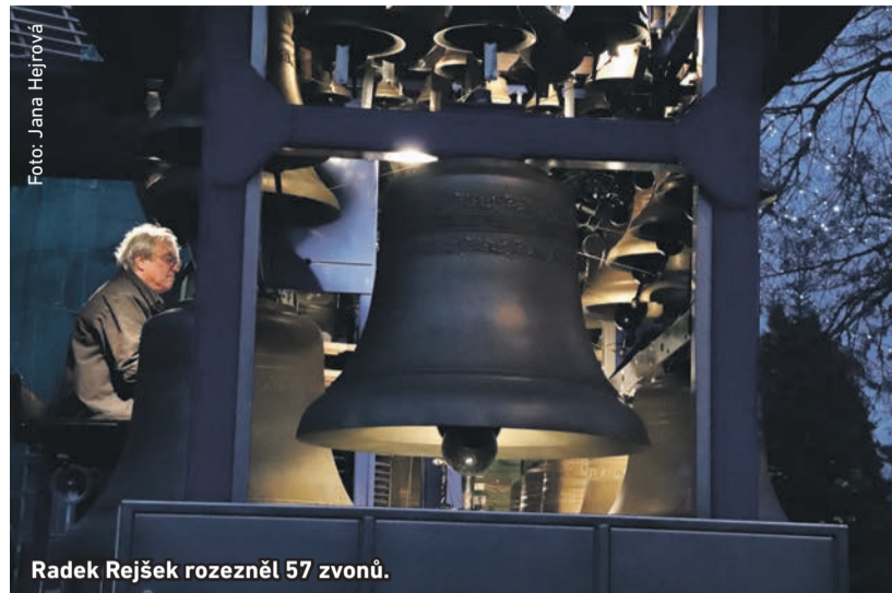
Radek Rejšek rozezněl 57 zvonů.