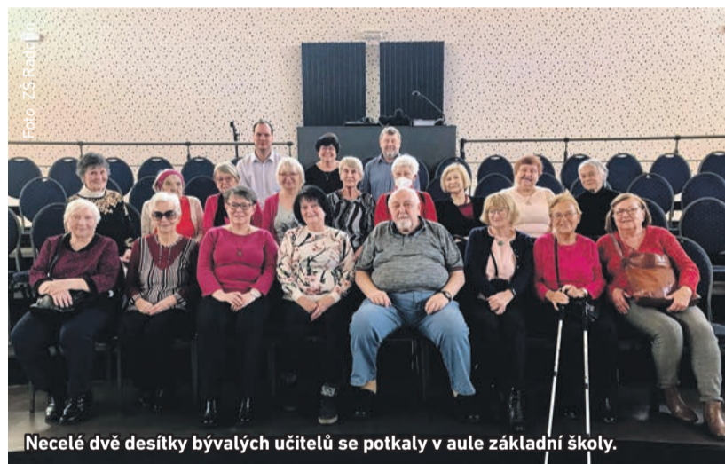
Necelé dvě desítky bývalých učitelů se potkali v aule základní školy.