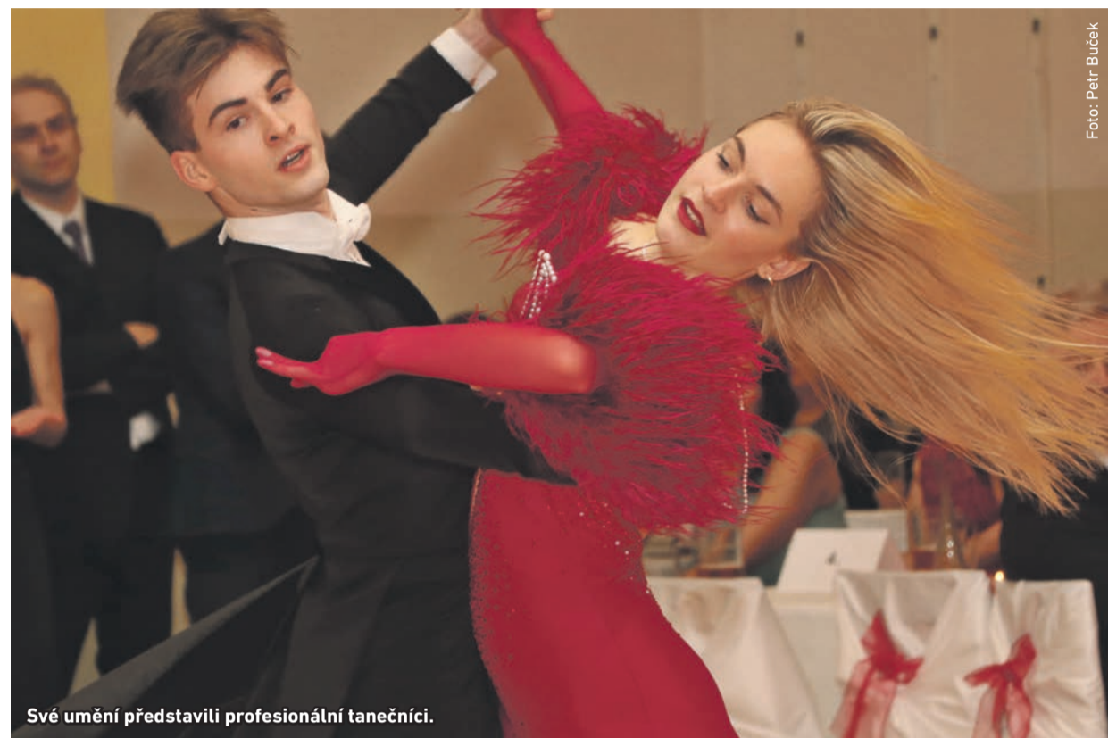
Své umění představili profesionální tanečnici.