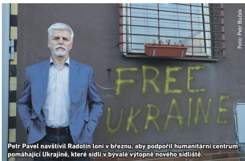
Petr Pavel navštívil Radotín loni v březnu, aby podpořil humanitární centrum pomáhající Ukrajině, které sídlí v bývalé výtopně nového sídliště.