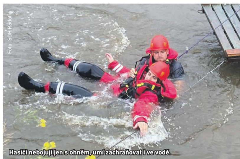
Hasiči nebojují jen s ohněm, umí zachraňovat i ve vodě.