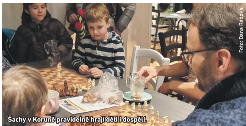
Šachy v Koruně pravidelně hrají děti i dospělí.