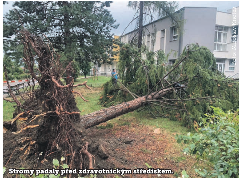
Stromy padaly před zdravotnickým střediskem.