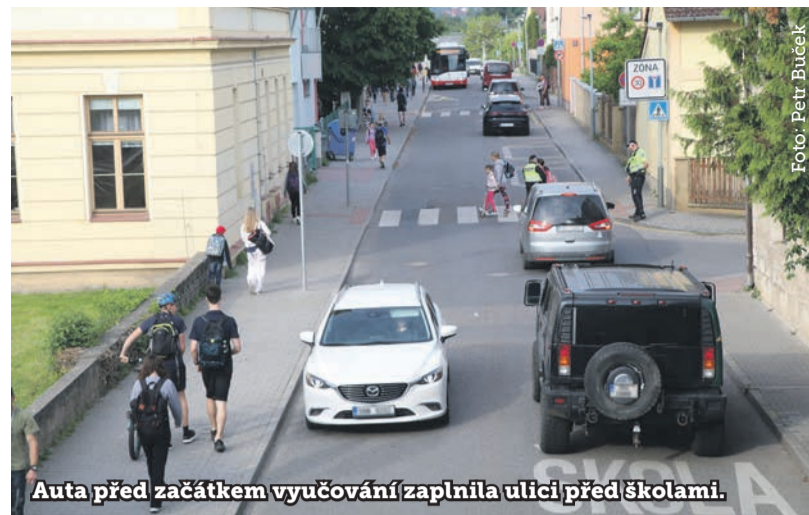
Autá před začátkem vyučování zaplnila ulici před školami.

Dopřejte svým dětem cestu do školy společně s kamarády a spolužáky. Jistě si vzpomínáte ze svého dětství, jaké velké výhody to má. Navíc eliminuje-