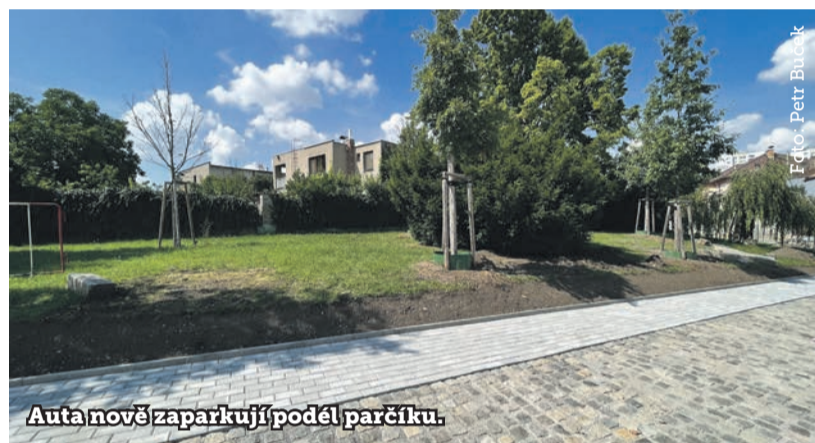
Autá nově zaparkují podél parčíku.

Změny jsou součástí projektového balíčku stavebních a krajinářských úprav ulice Václava Balého, které ra-