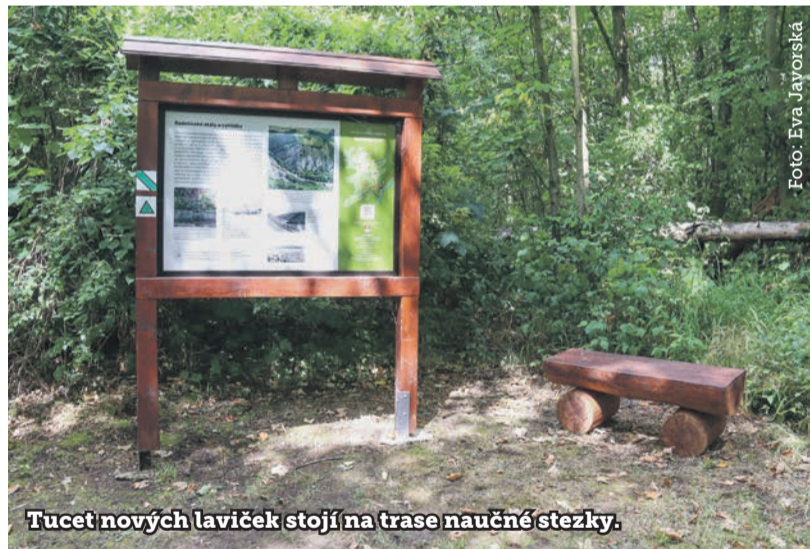
Tucet nových laviček stojí na trase naučné stezky.