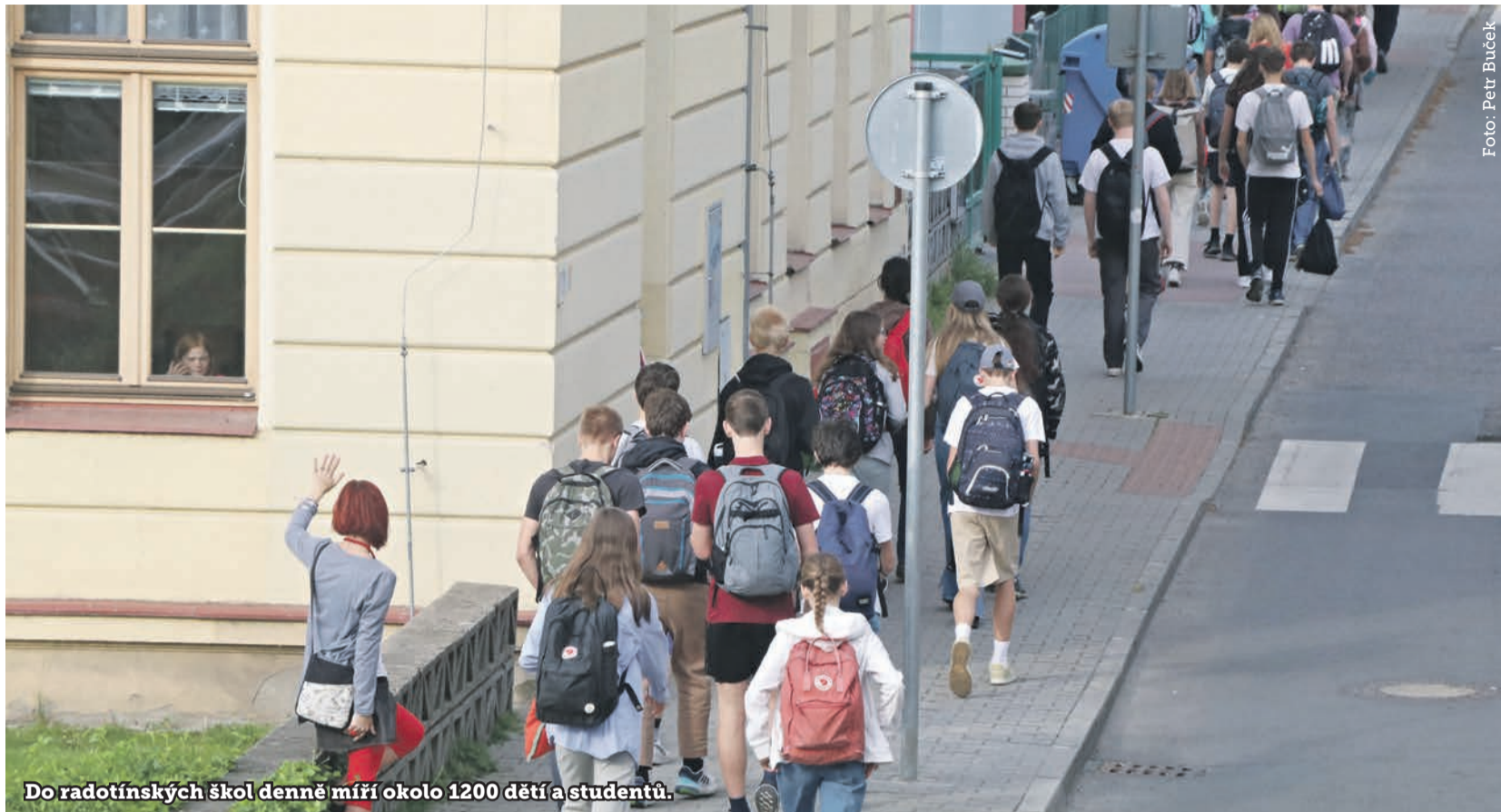
Do radotínských škol denně míří okolo 1200 dětí a studentů.

Ano, nádraží se školami nově spojuje lávka mezi ulicemi Na Betonce (navazuje na široký východ z nádražního podchodu směrem k Albertu) a tunýlkem