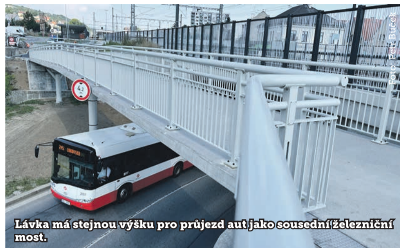
Obě lávky dostaly osvětlení umístěné v zábradlí.