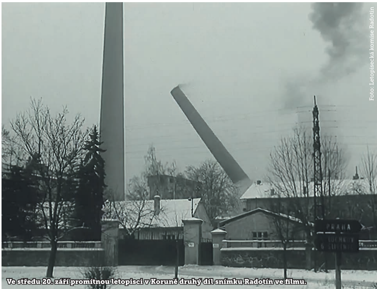
Ve středu 20. září promítnou letopisci v Koruně druhý díl snímku Radotín ve filmu.

20:00, Moje tlustá řecká svatba 3, USA Hrdinové legendární komedie Moje tlustá řecká svatba se vrací, aby názorně předvedli, co všechno se může stát, když se bláznivá rodina rozhodne hledat své kořeny. Řecko, měj se na pozoru.