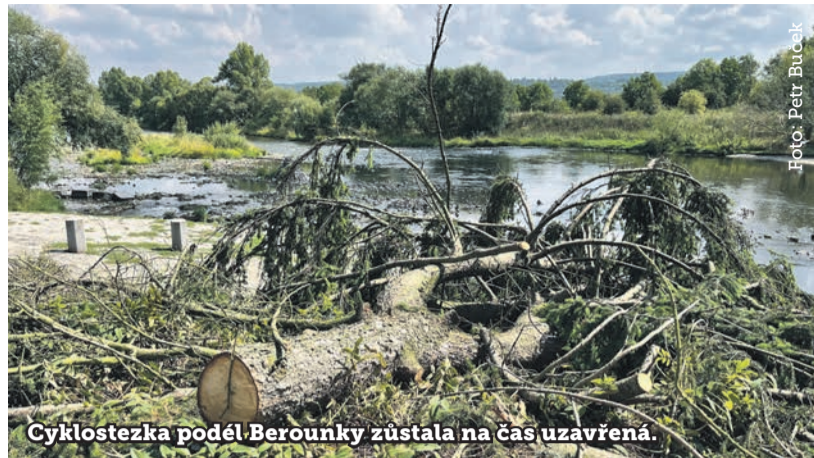
Cyklostezka podél Berounky zůstala na čas uzavřená.