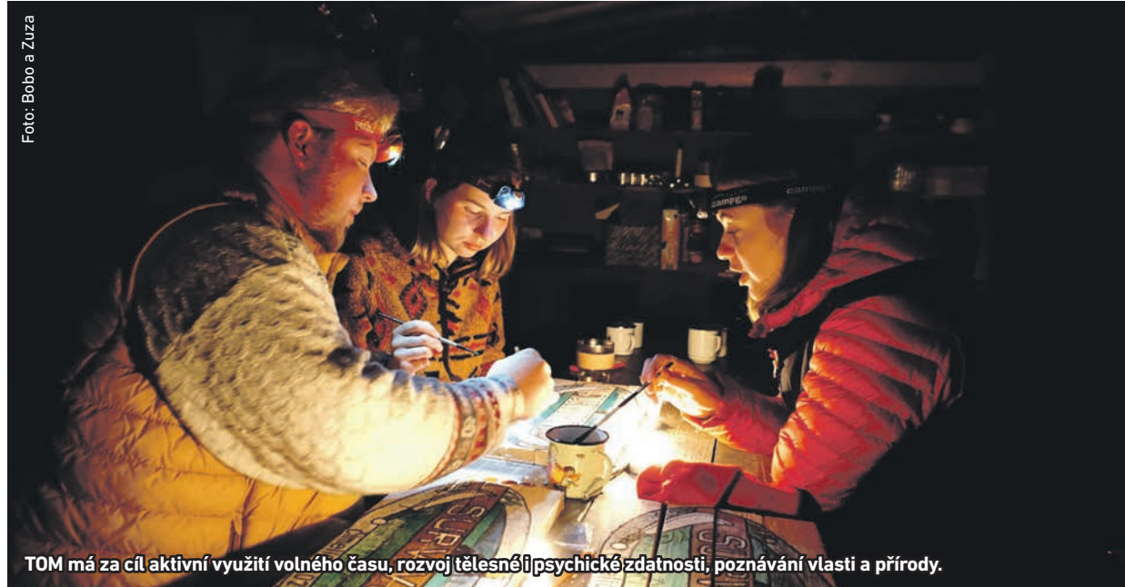
TOM má za cíl aktivní využití volného času, rozvoj tělesné i psychické zdatnosti, poznávání vlasti a přírody.

Radotínský Turistický oddíl mládeže (TOM) letos s ročním zpožděním zaviněným covidem oslavil půlstoletí svého fungování. Především děti a mládež dodnes učí nejen lásce k přírodě, ale také překonávat nejrůznější životní překážky. Jak ukazuje historie oddílu, různým nepříjemným okamžikům musela čelit několikrát i organizace samotná.