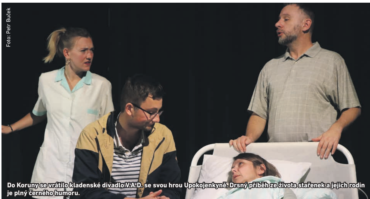
Do Koruny se vrátilo kladenské divadlo V.A.D. se svou hrou Upokojenkyně. Drsný příběh ze života stařenek a jejich rodin je plný černého humoru.