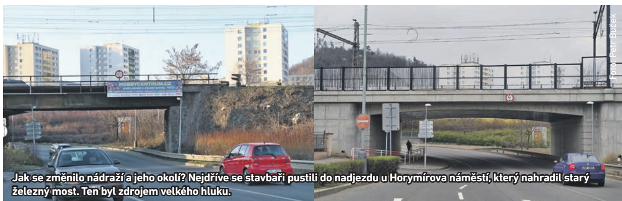
Jak se změnilo nádraží a jeho okolí? Nejdříve se stavbaři pustili do nadjezdu u Horymírova náměstí, který nahradil starý železný most. Ten byl zdrojem velkého hluku.