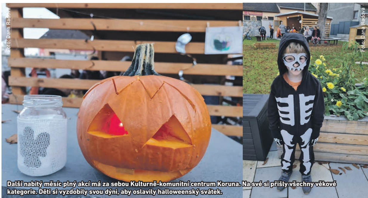
Další nabitý měsíc plný akcí má za sebou Kulturně-komunitní centrum Koruna. Na své si přišly všechny věkové kategorie. Děti si vyzdobily svou dýni, aby oslavily halloweenský svátek.