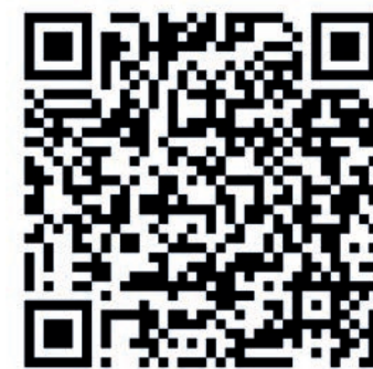
Odkaz na nové jízdní řády

Práce na trati způsobující zpoždění budou probíhat ještě v lednu. Zhruba od poloviny února by se dochvilnost vlaků měla výrazně zlepšit, přechodové období potrvá do března. Ten je také dalším termínem pro tvorbu nových jízdních řádů. ■