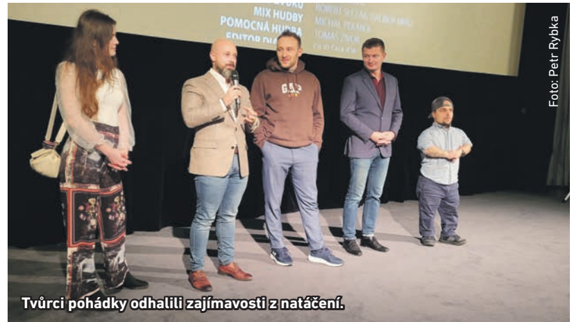
Tvůrci pohádky odhalili zajímavosti z natáčení.