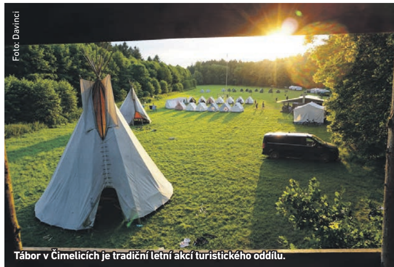
Tábor v Čimelicích je tradiční letní akcí turistického oddílu.