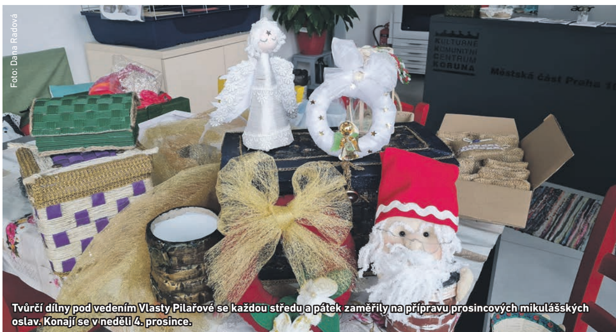
Tvůrčí dílny pod vedením Vlasty Pilařové se každou středu a pátek zaměřily na přípravu prosincových mikulášských oslav. Konají se v neděli 4. prosince.