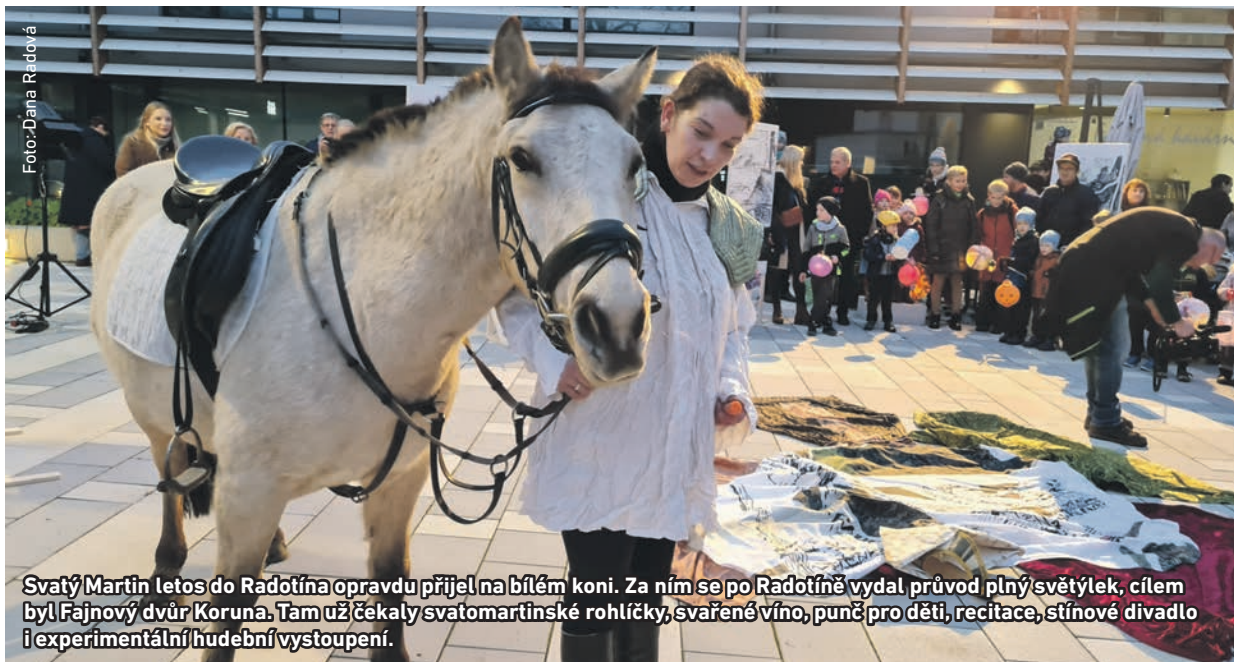
Svatý Martin letos do Radotína opravdu přijel na bílém koni. Za ním se po Radotíně vydal průvod plný světýlek, cílem byl Fajnový dvůr Koruna. Tam už čekaly svatomartinské rohlíčky, svažené víno, punč pro děti, recitace, stínové divadlo i experimentální hudební vystoupení.