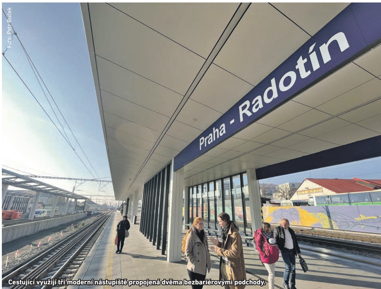
Cestující využijí tři moderní nástupiště propojená dvěma bezbariérovými podchody.

Prosinec přináší řadu významných změn na radotínském nádraží a v jeho blízkém okolí. Otevřou se oba nádražní podchody v celé své délce, řidiči začnou využívat podjezd na konci Prvomájové ulice a nebezpečný železniční přejezd vedle nádraží se přesune do historie.