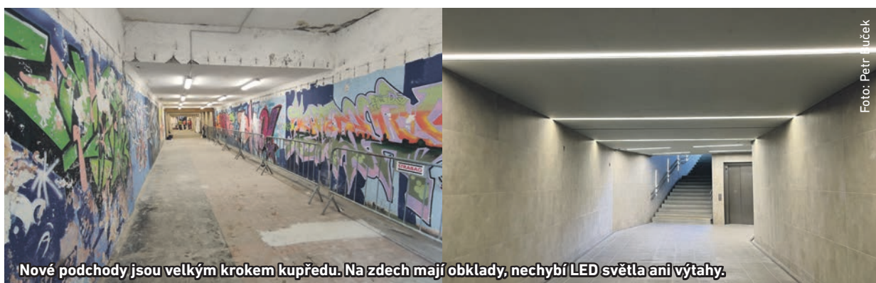
Nové podchody jsou velkým krokem kupředu. Na zdech mají obklady, nechybí LED světla ani výtahy.