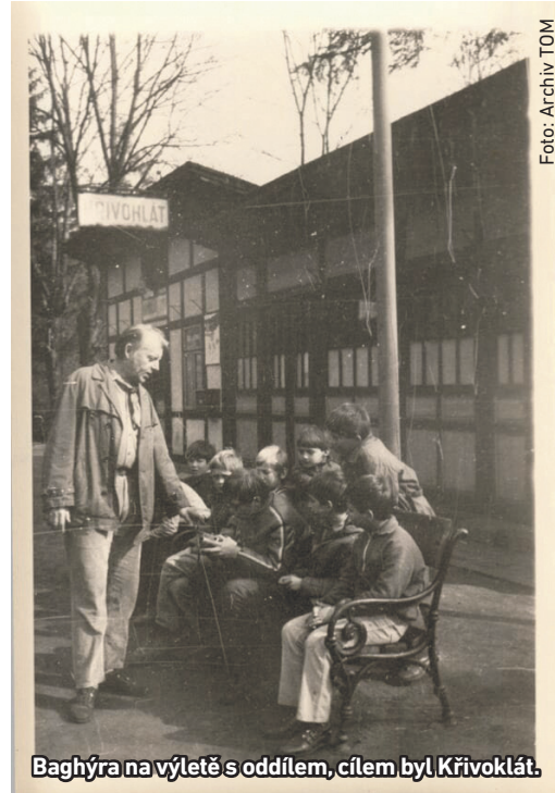
Baghýra na výletě s oddílem, cílem byl Křivoklát.

Zajímavostí také je, že své kořeny má v turistickém oddílu radotínská sportovní specialita, kterou je lakros. Ta se v Radotíně hraje od roku 1980. Jeho zakládající členové patřili do turistáku. Na letní tábor, který se tehdy konal v Klení ve „Slepčích horách“, jim přijeli představit tuto původně indiánskou zábavu zástupci oddílu Neskenon. Ještě předtím zkoušeli v turistáku jednoduchou verzi lakrosu hranou s klacky a koženými váčky.