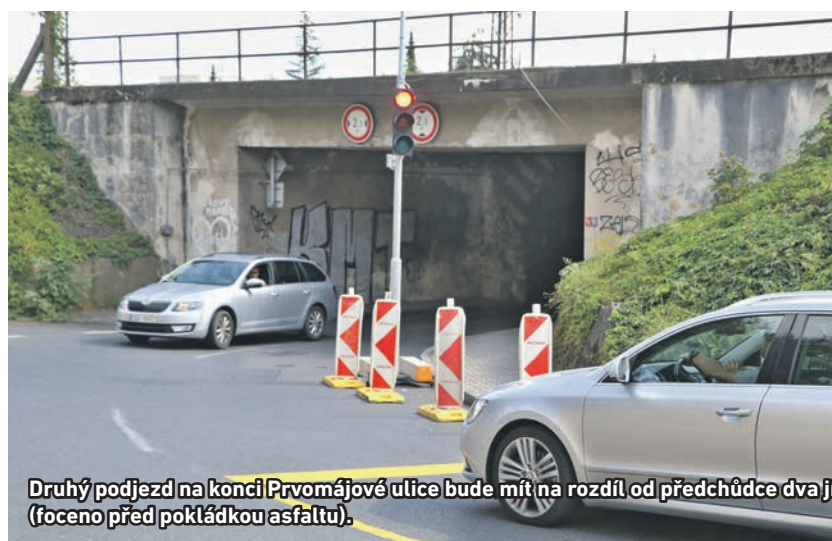
Druhý podjezd na konci Prvomájové ulice bude mít na rozdíl od předchůdce dva jízdní pruhy a široký chodník. I ten má být v provozu už v prosinci (foceno před pokládkou asfaltu).