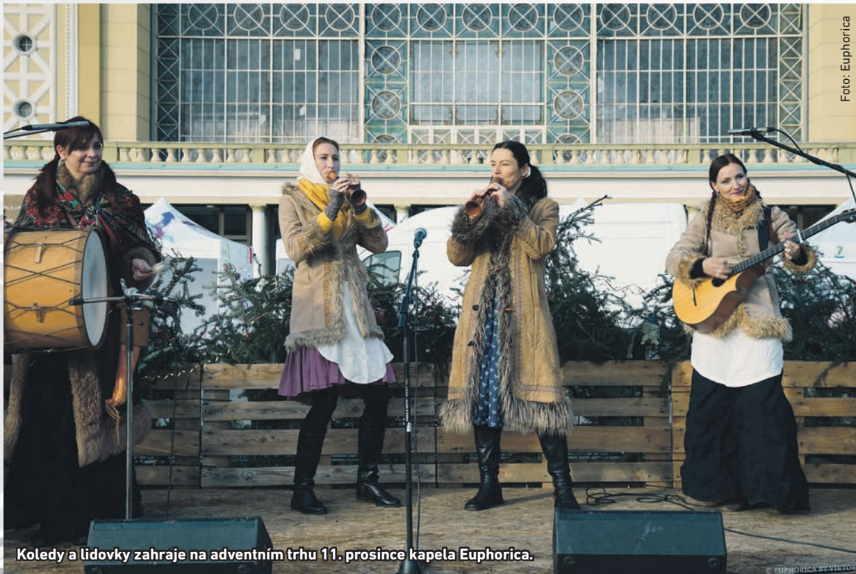
Koledy a lidovky zahraje na adventním trhu 11. prosince kapela Euphorica.