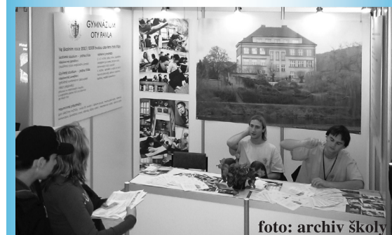
Momentka z výstavy

Schola Pragensis slouží jako nabídka pro žáky a jejich rodiče, kteří se roz-