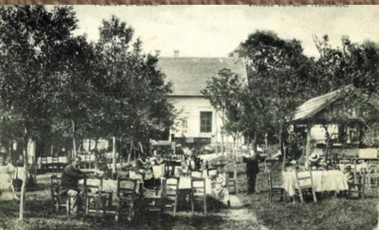
Zahradní restaurace patrně kolem roku 1910.

A takový pohled se na místo bývalého přívozu naskytá dnes.