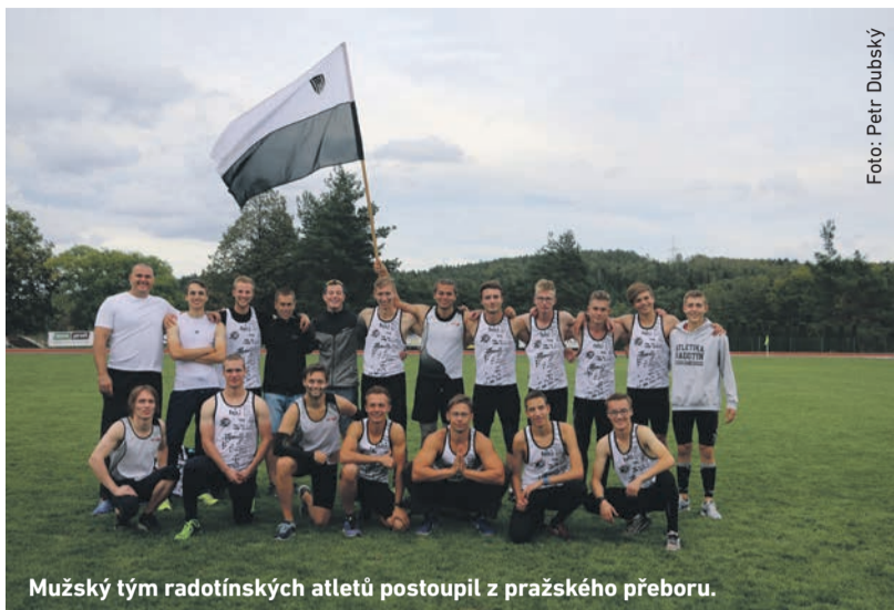
Mužský tým radotínských atletů postoupil z pražského přeboru.