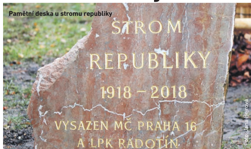
Pamětní deska u stromu republiky