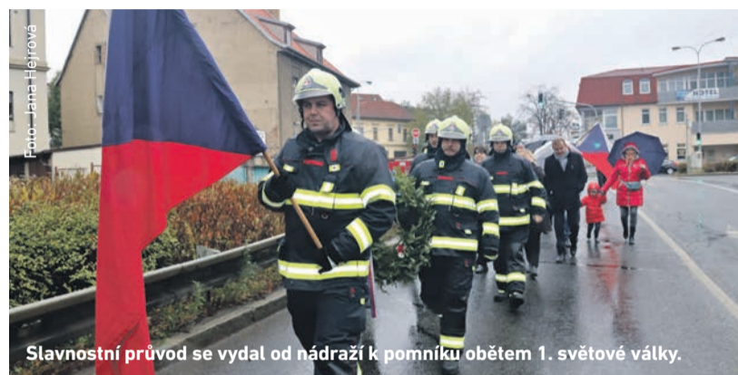
Slavnostní průvod se vydal od nádraží k pomníku obětem 1. světové války.