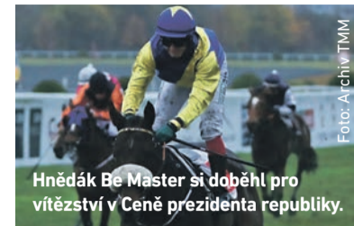
Hnědák Be Master si doběhl pro vítězství v Ceně prezidenta republiky.

V neděli 28. října skončila letošní dostihová sezona na centrálním českém závodistišti v Praze-Velké Chuchli. Vrcholem závěrečného dne byla Sherlog 98. Cena prezidenta republiky, tradiční nejdelší rovinový dostih nejvyšší kategorie. Na trať dlouhou 3200 metrů se vydalo deset aktérů a první tři místa si rozdělili zástupci tříletého ročníku.