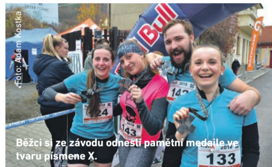
Běžci si ze závodu odnesli pamětní medaile ve tvaru písmene X.

Oproti červencovému běhu RunX, kdy závodníci absolvovali trať v okolí Berounky a rtuť teploměru neklesla pod 35 stupňů Celsia, čekali na běžce při podzimním závodě příjemnější počasí s teplotou mezi 10 a 12 stupni. Na 7,5 kilometru dlouhé trati zdolávali převýšení zhruba 250 metrů, hlavní závod měl délku 15 kilometrů a na běžce čekaly dva okruhy.