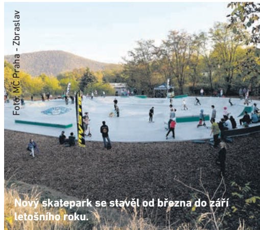
Nový skatepark se stávil od března do září letošního roku.