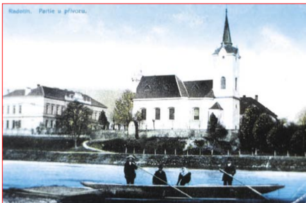
Tato pohlednice zase zobrazuje pravobřežní přístaviště převozníka