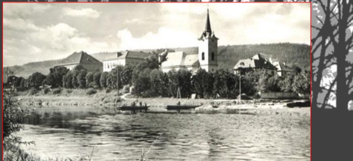
1955 – přívoz pracuje na stále stejném místě