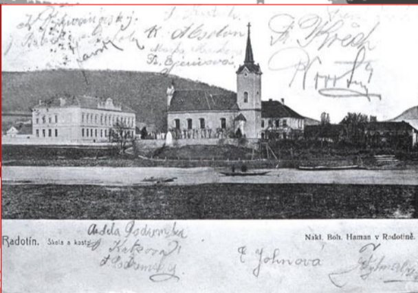
Totožné pohlednice s námětem přívozu – jednou se sbírkou podpisů, podruhé s kolorací