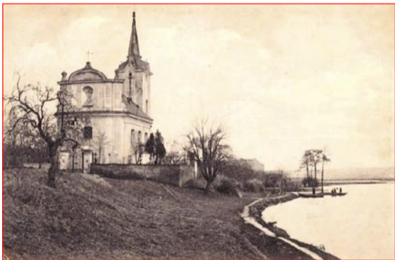
Partie u přívozu v roce 1916

Přívoz a brod v Radotíně přes Mži (nynější Berounku) je zmíněn již v listině Vladislava II. z počátku 12. století. Převozníková pramice pak po stejné řece pendlovala ještě v padesátých letech 20. století, než se tu objevil první ponton.