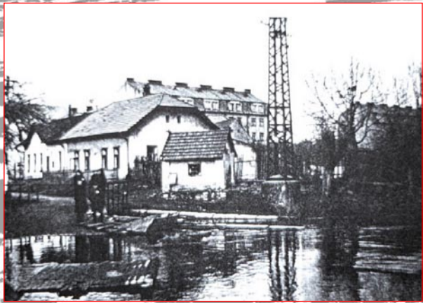
Snímek není moc dobrý, ale nejlépe přibližuje místo nástupu v Radotíně