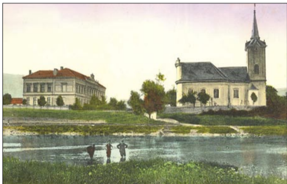
Rok 1913 – že by hledali brod na vlastní pěst?