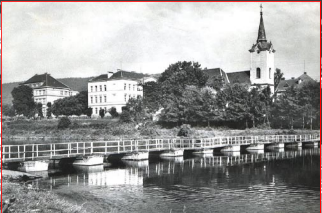
Rok 1970 – a pontonová lávka

Žádná z nich nezobrazuje brod – pokud byste někdo měl a mohl zapůjčit fotografii s brodem či jiný neznámý pohled na toto místo, dejte nám, prosím vědět.