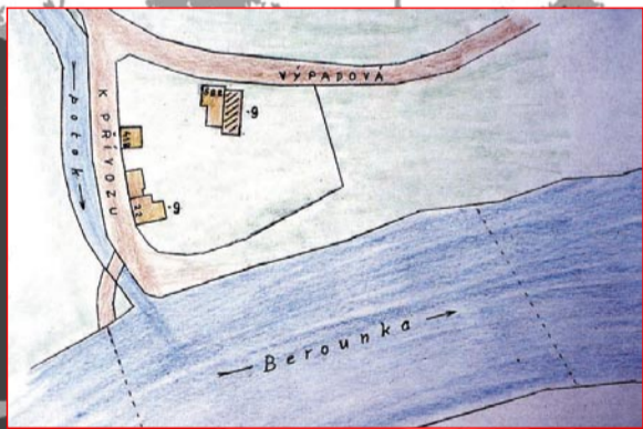
Také vás už napadlo, proč jde lávka přes Radotínský potok šikmo? Kresba napoví – mířila přímo k přívozu