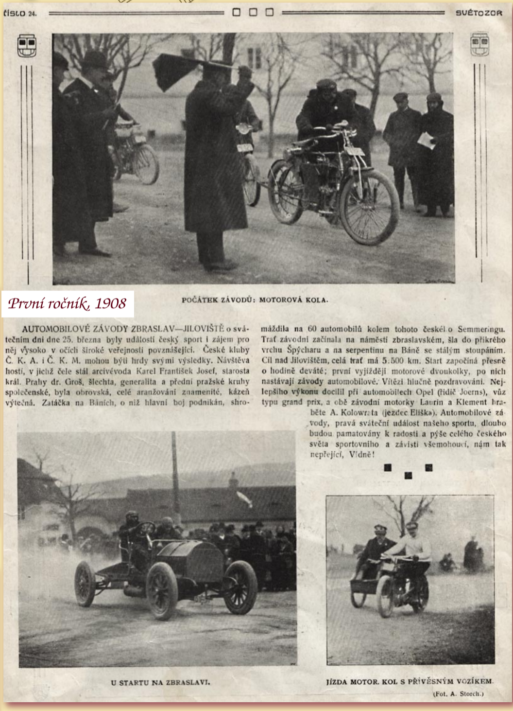
U STARTU NA ZBRASLAVI. JÍZDA MOTOR. KOL S PŘÍVĚSNÝM VOZÍKEM.

materiály poskytl: Veteran Car Club Praha, text: Jaroslava Brutarová